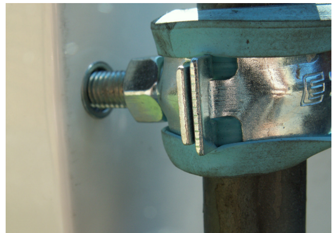
Nærbilde av festing mot skap.

Monter de medfølgende 4 bolterne på skapets bakside (på skapet finnes gjengehull). Skru rørklammerne på bolterne på baksiden av skapet. Skyv rundstangene gjennom rørklammerne og skyv varerørene på rundstangene. De 2 varerørene forhindrer at stålstolpene støps fest hvilket gjør at stolpene kan benyttes på nytt. Slå ned rundstangene gjennom isolasjon og ned i gruset tils at montasjet føles stabilt. Løft opp skapet på riktig høyde og skru fest klammerne.