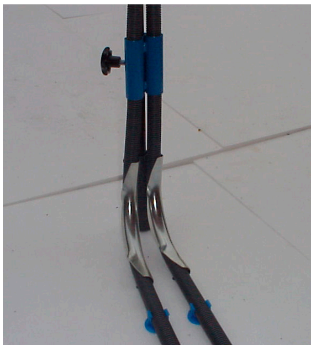
Billedet viser montering med LK Rørstolpe dobbelt, sammen med LK Bukkefix PL 25 samt LK Rørstøtte 20-25 mm.