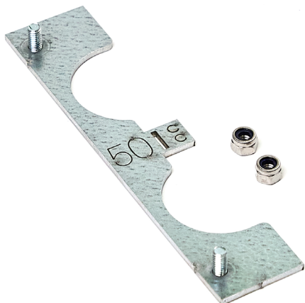
LK Radiatorfikstur Distans med muttere.