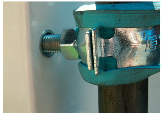
Nærbilde av festing mot skap.

Monter de medfølgende 4 bolterne på skapets bakside (på skapet finnes gjengehull). Skru rørklammerne på bolterne på baksiden av skapet. Skyv rundstangene gjennom rørklammerne og skyv varerørene på rundstangene. De 2 varerørene forhindrer at stålstolpene støps fest hvilket gjør at stolpene kan benyttes på nytt. Slå ned rundstangene gjennom isolasjon og ned i gruset tils at montasjet føles stabilt. Løft opp skapet på riktig høyde og skru fest klammerne.