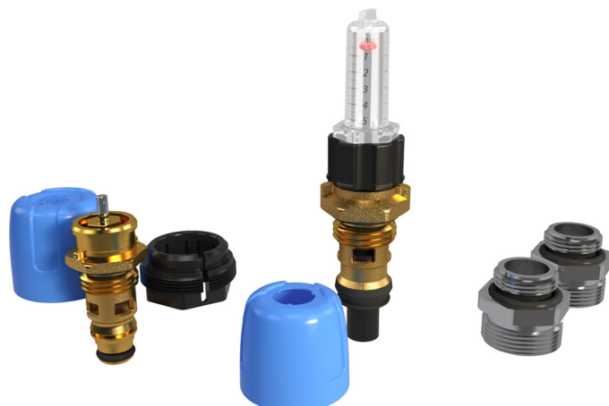
LK Ventilsett VKF RF, NRF 836 43 57